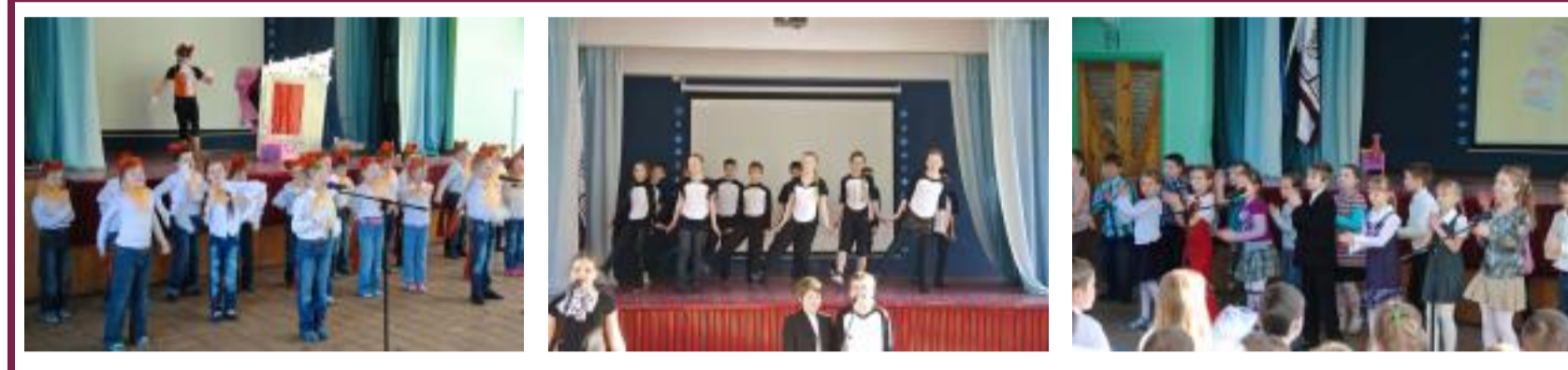
Смотреть ещё фотографии с конкурса

Читать ещё о конкурсе (статья Светланы Шипулиной)